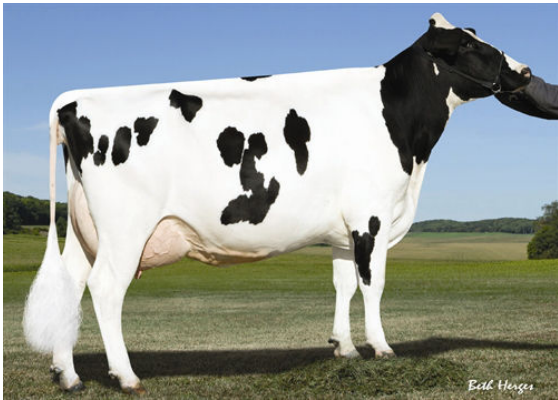
PINE-TREE MONICA PLANETA FIFTH DAM